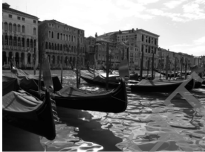
Giovanni Battista Benedetti (1530–1590) wurde in Venedig geboren, wo die Wissenschaften blühten