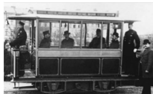
Die erste Straßenbahn

Das Arbeitsfeld der Firma war der Bau von Telegrafleitungen. Unter anderem begann man 1874 mit der erfolgreichen Verlegung von Transatlantikkabeln zwischen Europa und Nordamerika. 1881 wurde die erste elektrische Straßenbahnlinie der Welt in Berlin eröffnet.