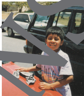
limpiar coches, mendigar, gases contaminantes