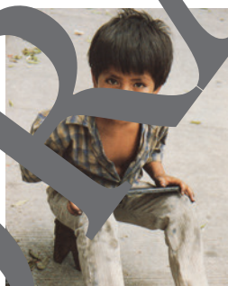
trabajar de limpiabotas, pedir limosna