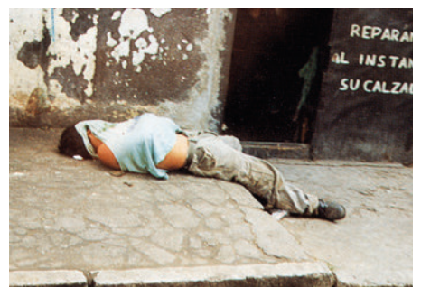
dormir en el suelo, olvidarse del frío y del miedo, estar drogado/consumir drogas/inhalar pegamento (Resistol)