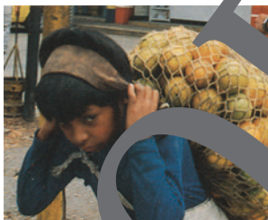
llevar una carga muy pesada, sobreprotección