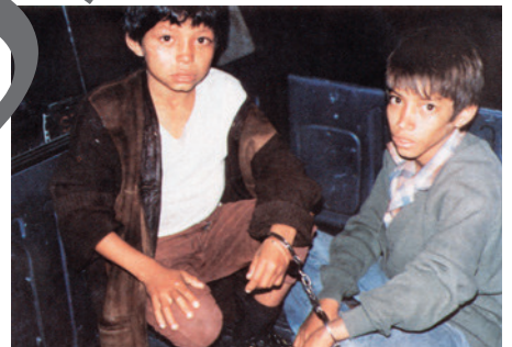
detener a alguien, pasar hambre, robar, marginar a alguien