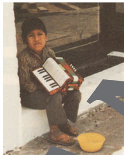
música callejera, perder la vida, perderse de la niñez