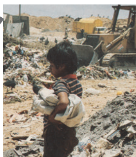
vivir en el basurero, buscar comida, recolectar basura para venderla