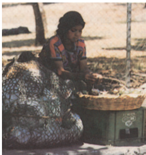
vender cosas, salir de la miseria

Parece que está + adjetivo • Es posible/probable/imaginable que + sustantivo • Pueden + verbo subjuntivo (p. ej. sea + adjetivo) • Tiene una cara/una expresión (muy) + adjetivo • Sus ojos muestran/transmiten + sustantivo