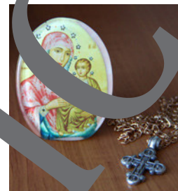
11) Heiligenbild (Postkarte) und Medaille von Massabielle in Lourdes