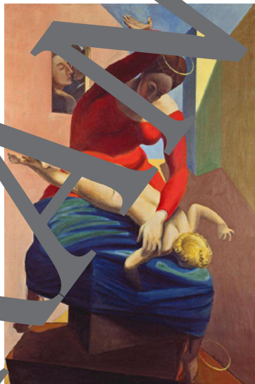
13) Max Ernst: Die Jungfrau züchtigt das Jesuskind vor drei Zeugen: André Breton, Paul Éluard und dem Maler, 1926