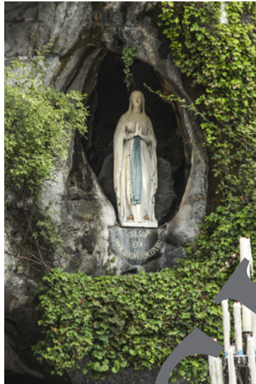
10) Marienstatue in der Grotte von Massabielle in Lourdes