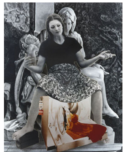
14) Valie Export: Die Geburtenmadonna, 1976