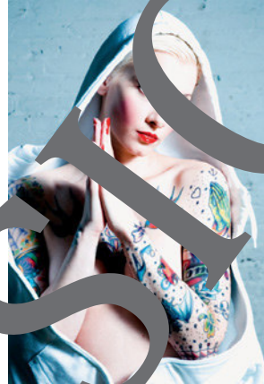
Bild Mitte © VG Bild-Kunst, Bonn 2021 Bild rechts © Maïke Brautmeier

Gottesmutter, Himmelskönigin, Schutzpatronin, aber auch Femme fatale und Frauenrechtlerin – keine Frau hat so viel Beachtung und Verehrung erfahren. Auch wenn eine andere Frauengestalt über die Jahrhunderte hinweg so häufig dargestellt wurde. Kein Wunder also, dass sich in der Vielzahl der Marienbilder nicht nur künstlerische, sondern auch theologische und gesellschaftliche Entwicklungen bis in die heutige Zeit widerspiegeln. Anhand einer Auswahl an Kunstwerken können die Schülerinnen und Schüler diese Entwicklungen nachvollziehen oder sich mit einzelnen Bildtypen, Werken oder Künstlern theoretisch und gestaltungspraktisch auseinandersetzen.