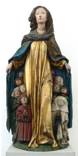
9) Ravensburger Schutzmantelmadonna, um 1480