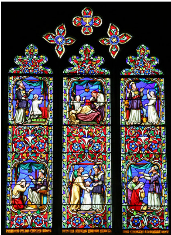
Fenster in der Kathedrale von Ely, 14. Jh.