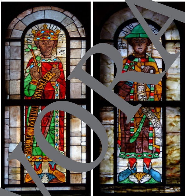
Fenster in der Kathedrale von Augsburg (König David