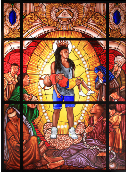
Kehinde Wiley: Mary, Comforter of the Afflicted, 2016 I

© Kehinde Wiley, Courtesy of Galerie Templon, Paris