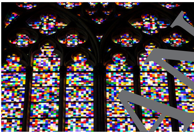
Gerhard Richter: 'Südquerscheitelpfeiler', nach einem Entwurf von Gerhard Richter, Detail, 2007

© Entwurf: Gerhard Richter, Köln