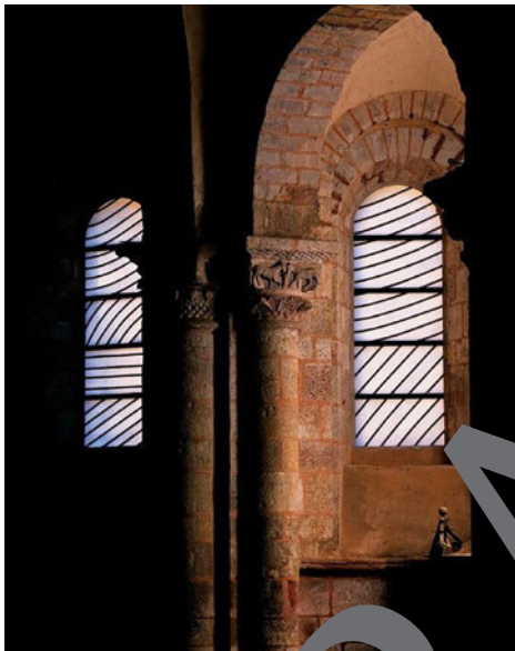
Pierre Soulages: Fenster in Sainte-Foy, Conques, 1987–1994