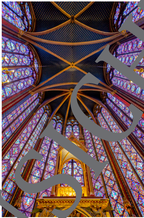
Fenster in Sainte-Chapelle in Paris, 13. Jh.