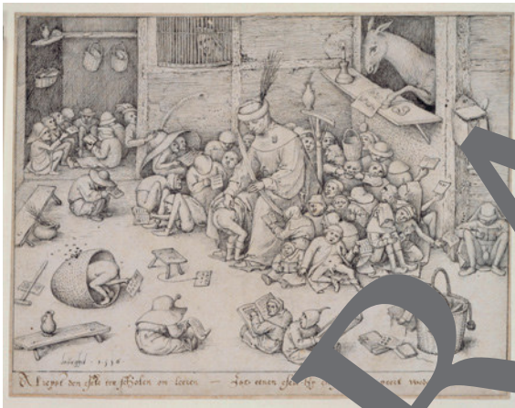
3) Pieter Bruegel: Der Esel in der Schule, 1568; Federzeichnung auf Papier, 23,2 x 32,2 cm; Kupferstichkabinett Preußischer Kulturbesitz, Berlin