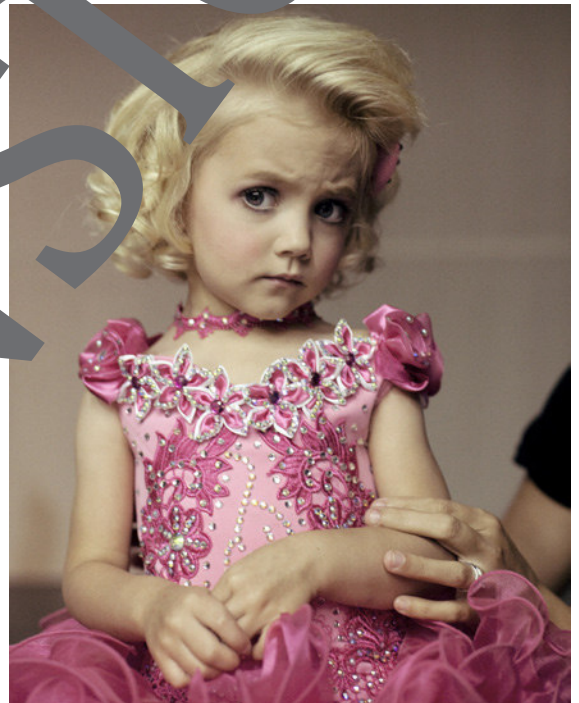
16) Lærke Posselt: USA: Beautiful Child, 2012