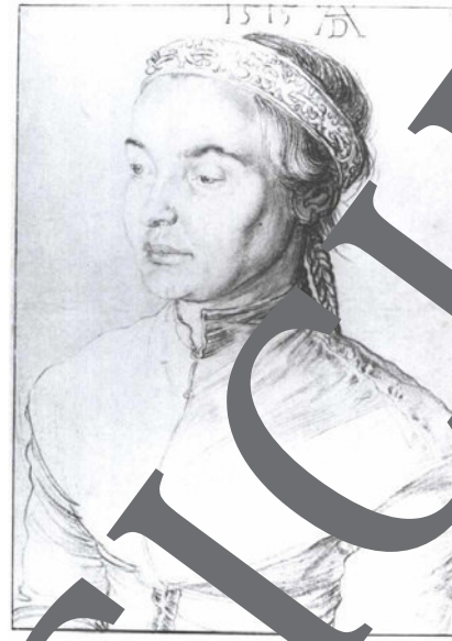
2) Albrecht Dürer: Bildnis eines jungen Mädchens, 1504; Kupferstich auf weißem Papier, 42 x 29 cm; Kupferstichkabinett Preußischer Kulturbesitz, Berlin