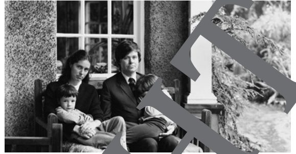
14) Thomas Struth: The Struth Family (Panorama) Edinburgh 1985, Fotografie, 29,5 x 57,5 cm © Thomas Struth