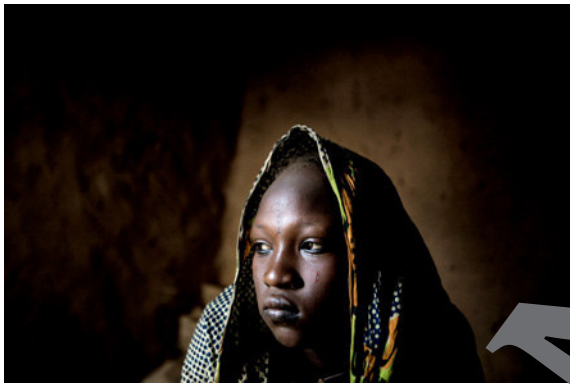
15) Mads Nissen: Niger: Ouma an ihrem Hochzeitstag, 2005, Fotografie © Mads Nissen/laif