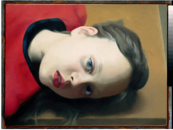
13) Gerhard Richter: Betty, 1977; Öl auf Leinwand, 30 x 40 cm; Museum Ludwig, Köln © Gerhard Richter 2025 (0075)