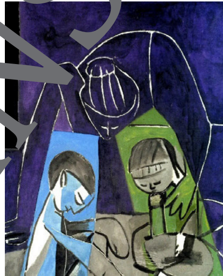
12) Pablo Picasso: Claude zeichnend, Françoise und Paloma, 1954; Öl auf Leinwand, 116 x 89 cm; Musée Picasso, Paris