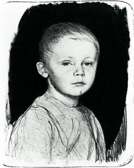
9) Käthe Kollwitz: Bildnis von Hans Kollwitz, 1896; 26,4 x 20,6 cm, Lithografie; Kupferstichkabinett Preußischer Kulturbesitz, Berlin