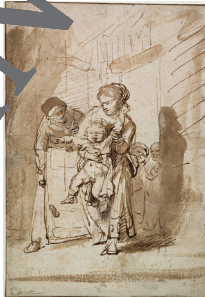
4) Rembrandt: Der ungezogene Knabe, um 1635; Federzeichnung, laviert und mit Weiß gedeckt, 20,6 x 14,6 cm; Kupferstichkabinett Preußischer Kulturbesitz, Berlin