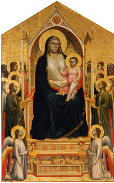
1) Giotto di Bondone: Ognissanti-Madonna, um 1310; Tempera auf Tafel und Goldgrund, 325 x 204 cm; Galerie degli Uffizi, Florenz