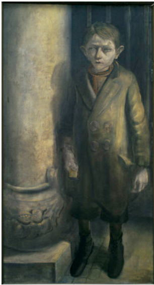
11) Otto Dix: Der Streichholzhändler II, 1927; Mischtechnik auf Holz, 120 x 65 cm; Kunsthalle Mannheim