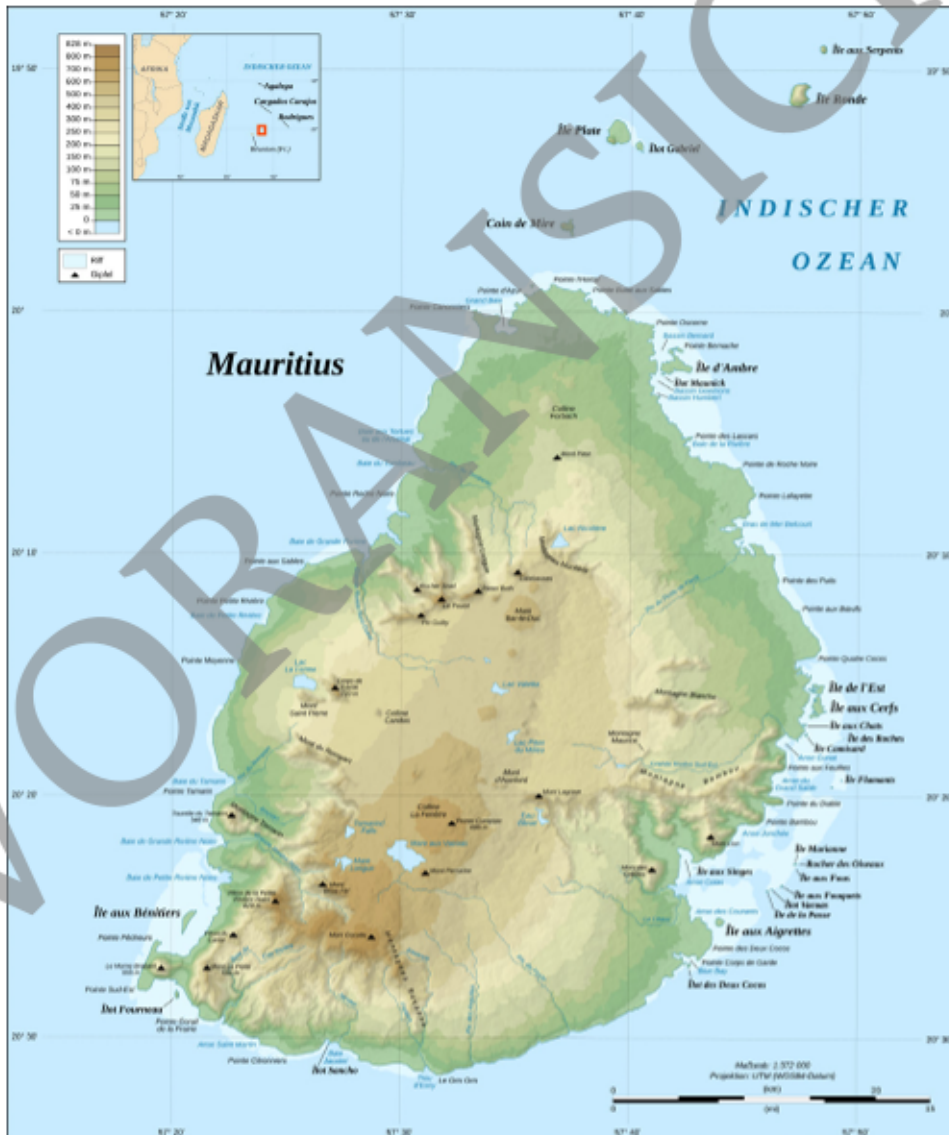
© Eric Gaba/ Wikimedia cc by sa 4.0 https://commons.wikimedia.org/wiki/File:Mauritius_Island_topographic_map-de.svg

© RAABE 2026 | Es gelten die Lizenzbedingungen!