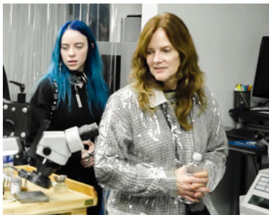
Billie mit ihrer Mutter Maggie Baird 2018

Billie Eilish wurde in eine aus Irland stammende Schauspieler- und Musikerfamilie hineingeboren. Der Schauspieler und Musiker Finneas O'Connell ist ihr älterer Bruder. Ihr Zweitname Eilish ist die anglisierte Form von Eilís, einer gälischen Form des Vornamens Elisabeth. Sie ging nicht auf eine öffentliche Schule, sondern wurde zu Hause unterrichtet. Im Alter von acht Jahren begann sie im Los-Angeles-Kinderchor (Los Angeles Children's Chorus) zu singen.