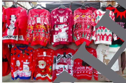
Pullover mit weihnachtlichen Motiven.

„Blue Christmas“ wurde von Elvis 1957 erstmals in dem „Elvis Christmas Album“ veröffentlicht. Darauf war auch „White Christmas“ zu finden, das in der Version von The Crosbys aus dem Jahre 1942 die erfolgreichste Single überhaupt ist. Seitdem haben zahlreiche weitere Stars Weihnachts-songs veröffentlicht.