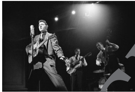
Elvis live 1956.