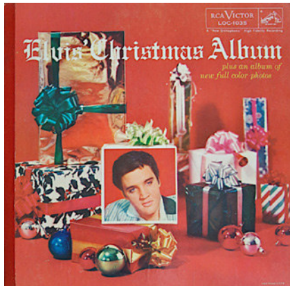
Elvis Christmas Album (RCA Victor 1957).