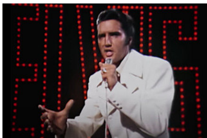
Elvis (1935–1977) im Finale des Weihnachtsspecials im Jahre 1968. Screenshot.