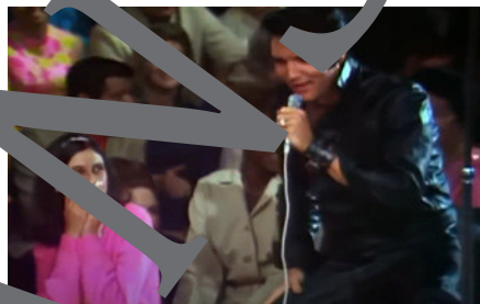
Mit Martina McBride im Weihnachtsspecial (1968)

Im Jahr 2008 veröffentlichte die Plattenfirma RCA „Blue Christmas“ als Duett von Elvis mit der 1966 geborenen Martina McBride sowie das dazugehörige Promotion-Video (M 1).