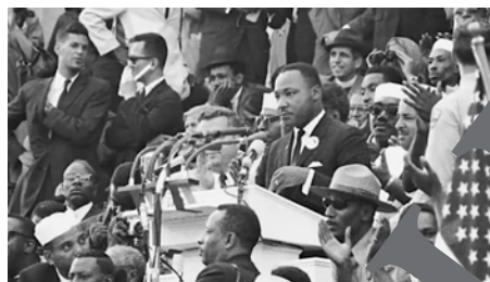
Martin Luther King (1929–1968) spricht während des March on Washington für Jobs and Civil Rights im Jahre 1962. Screenshot.

I Can Dream T+ M: Walter Earl Brown, © Elvis Presley Music/ ABG/Elvis Songs/Universal Music Publishing GmbH