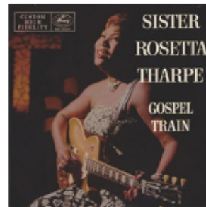
Cover der LP „Gospel Train“ (Rosetta Tharpe/Mercury 1956).

Die nachfolgenden Übungen sind an das Blues-artige Traditional „Up Above my Head“ in der Live-Version von Rosetta Tharpe aus dem Jahr 1964 angelehnt ( https://raabe.click/abovemyhead ). Dieses war von ihr im Jahre 1947 erstmals in einer Fassung mit Marie Knight veröffentlicht worden, 1956 erfolgte eine neue Version auf dem Album „Gospel Train“.