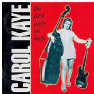
Plattencover der LP "Carol Kaye – The first Lady on Bass (Hot Wire Records 1994).