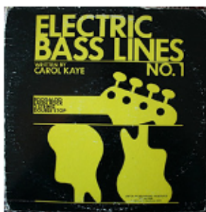
Cover der Begleitplatte zum ersten Band der Schule „Electric Basslines“ (GP Records 1970).

Video-Tutorial: Carol Kaye's Favorite Basslines: https://raabe.click/top5carolkaye