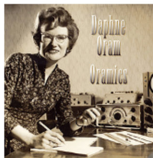
CD-Cover aus dem Jahre 2007