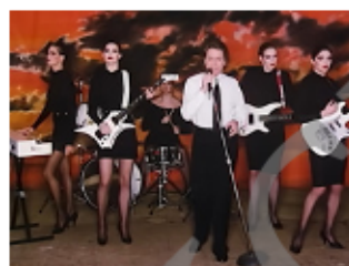
Screenshot aus dem Video zu „Addicted for Love“ (Robert Palmer 1985).