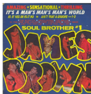
Albumcover von „This is a man’s world!“ (James Brown/Pye International 1966).

He’s lost in the wilderness He’s lost in the bitterness He’s lost, Lord have mercy now