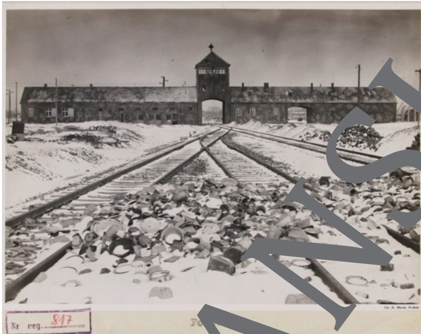
Starobrzeg, w Mucharowie, aus dem Konzentrations- und Vernichtungslager Auschwitz-Birkenau, in dessen Befreiung durch Truppen der Roten Armee im Januar 1945, Mitte Februar/ Mitte März 1945.