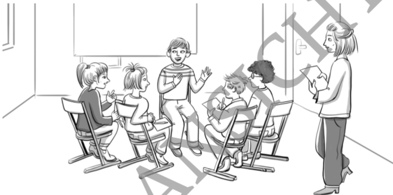
Illustration: Julia Lenzmann

Warum hat Ruth ein Problem damit, dass Edek mit Sofia wieder glücklich ist?