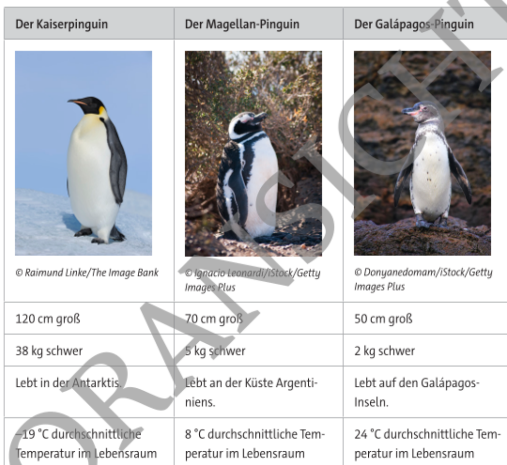
Tabelle 1: Vergleich des Körperbaus dreier Pinguinarten aus unterschiedlichen Lebensräumen

Betrachte Tabelle 1 und beschreibe den Zusammenhang zwischen der Körpergröße der Pinguine und der Temperatur ihres Lebensraums.